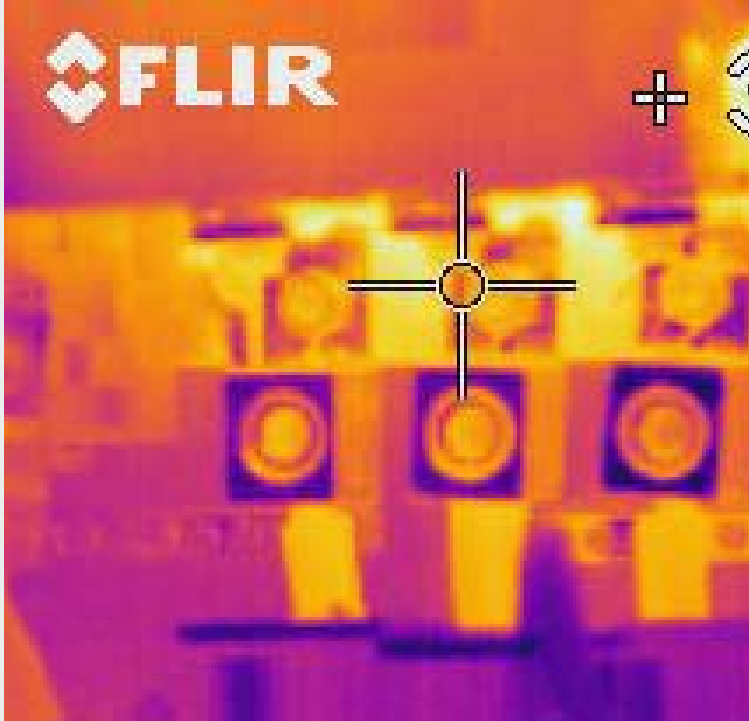
Wärmebild einer Kontaktleiste